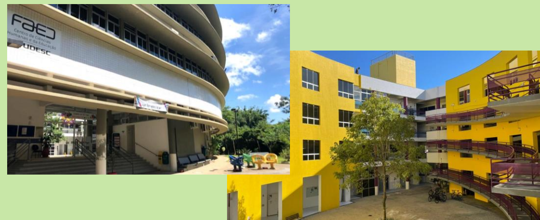
Sala do NAPE